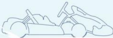
KART CRG390 CENTURION